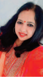
करुणा कलिका बोकोरो स्टील सिटी-झारखंड