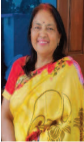
मनु हेदराबाद, तेलंगाना