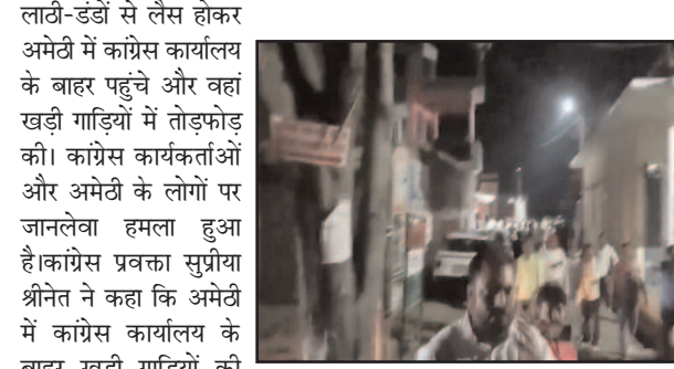
गाड़ियाँ तोड़ने से बात नहीं बनेगी भाजपाईयों! यूपी कांग्रेस प्रभारी

नई दिल्ली, (हि.स.) । राष्ट्रीय परीक्षा एंजेसी (एनटीए) ने सोमवार को स्पष्ट किया है कि मीडिकल प्रवेश परीक्षा 'नीट-यूजी-2024' में प्रश्नपत्र लीक होने का दावा करने वाले समाचार 'पुरी तरह से निराधार' हैं। प्रत्येक प्रश्न पत्र का 'हिसाब रखे जाने' का दावा करते हुए एनटीए ने कहा कि सोशल मीडिया पर प्रसारित प्रश्नपत्र की कथित तस्वीरों का वास्तविक प्रश्नपत्र से कोई सम्बन्ध नहीं है। एनटीए ने कहा कि छात्रों, अभिभावकों, शिक्षकों और सभी संबंधित लोगों को सूचित किया गया है कि परीक्षा के सम्बंध में सोशल मीडिया प्लेटफार्मों पर प्रसारित पोस्ट के माध्यम से यह धारणा बनाई जा रही है कि परीक्षा शुरू होने से पहले प्रश्न पत्र लीक हो गया था। इस आशय की पोस्ट पूरी तरह से निराधार हैं। एनटीए ने आगे कहा कि परीक्षा केंद्र बंद कर दिये गए थे और बाहर से किसी को भी हॉल के अंदर प्रवेश की अनुमति