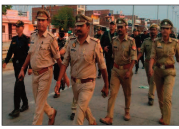
परेशान करता है। प्रलोभन देता है तथा वोट न डालने की धमकी देता है तो तुरंत पुलिस को सूचना दे पुलिस बल एसे अराजक तत्वों से सख्ती से निपटेगी।

लोकमित्र ब्यूरो कौंधियारा (प्रयागराज)। आगामी लोकसभा चुनाव के मद्देनजर दिन गुरुवार को पुलिस और पैरामिलिट्री फोर्स के जवानों ने फ्लैग मार्च कर क्षेत्रीय ग्रामीणों को सुरक्षा का भरोसा दिलाया। कौंधियारा थानाध्यक्ष की अगुवाई में क्षेत्र में ग्रामीणों को आगामी लोकसभा चुनाव में भयमुक्त होकर मतदान किए जाने को लेकर फ्लैग मार्च किया गया। लोगों से आगामी आने वाले चुनाव को शांतिपूर्ण ढंग से मतदान किए जाने को लेकर अपील की गई। साथ ही साथ लोगों से कहा कि अगर कोई भी दंगल किस्म का व्यक्ति अनावश्यक रूप से मतदाता को