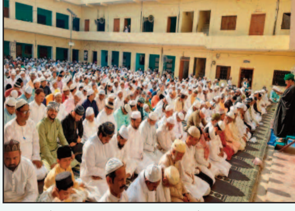
सिंवाई खाते हैं। ईद के दिन हर घर में सिंवाई बनती है जो ईद का तोहफा

लोकमित्र ब्यूरो फूलपुर। फूलपुर थाना क्षेत्र में ईद की नमाज परंपरागत ढंग से शांतिपूर्ण माहौल में अदा की गई। बच्चों एवं बड़े नये-नये परिधानों में मस्जिद ईदगाह पहुंचकर दो रकअत नमाज ईदुलफितर अदा किया। फिर मुल्क और कौम की खुशहाली व भाईचारे अमन की दुआएं की गई। रमजान के 30 रोजों की गिफत में ईद का तोहफा मिला था। ईद के दिन गरीब अमीर छोटे बड़े सभी नए परिधानों में ईदगाह जाकर दो रकअत नमाज अदा करके अल्लाह पाक का शुक्र अदा करते हैं। उसके बाद गांव मोहल्ले में धूम धूम कर