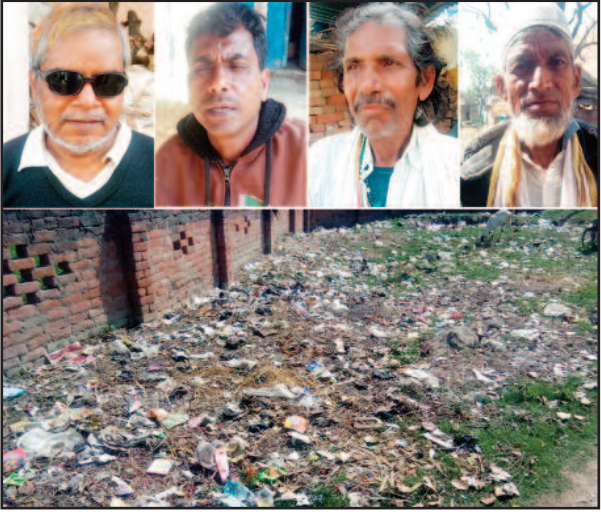
एक हजार व सामान्य जाति की आबादी लगभग एक हजार है। गांव में विकास के नाम पर खानापूर्ति की जा रही है। गांव की मुख्य सड़क पर वर्षों

लोकमित्र ब्यूरो करारी, कौशांबी। सदर ब्लॉक क्षेत्र के पारा हसनपुर गांव आज भी विकास के लिए तरस रहा है। आलम यह है कि गांव के तमाम रास्ते कच्चे पड़े हैं और नालियों के अभाव में रास्ते दलदल में तब्दील होते जा रहे हैं। प्रधान सचिव के विकास कार्य महज महज कागजों तक ही सीमित है। गांव में विकास कार्य नहीं दिख रहा है। लोगों की माने तो ग्राम प्रधान सचिव विकास कार्य के नाम पर जमकर सरकारी धन का बंदर बांट कर रहे हैं। तभी तो गांव में विकास कार्य शून्य दिख रहा है। जबकि गांव पाराहसनपुर गांव की आबादी लगभग सात हजार की है। इसमें दो राजस्व गांव खदेवरा, बदलेपुर व मजरे महेलीतर व लेहरा है। इस गांव में पिछड़ी जाति पांच हजार, दलितों की आबादी लगभग