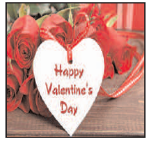
यात्रा का आशीर्वाद मांगा। सीढ़ियों पर बैठकर सपने भी बुने और होटलों में नास्ता किया। प्यार के इजहार का पहरा भी रहा।

लोकमित्र ब्यूरो प्रतापगढ़। पश्चिमी देशों में लोकप्रिय वेलेन्टाइन डे का फ्रेज बेल्हा के युवाओं पर छाया रहा। बुधवार को इस मौके पर कुछ संगठनों का पहरा होने के बावजूद भी दिल वाले कहीं न कहीं मिले और अपने प्रेम का इजहार किया। शहर में वैश्य तो सार्वजनिक स्थल पार्क आदि कम है। लेकिन इससे दिन वाले चिन्तित नहीं हुए। वे कम्पनी बाग पहुंचे और वहां एक दूसरे से मिले। बेल्हा देवी धाम और सांड दाता कुटी में भी दीवानो का जमघट रहा। धाम की सीढ़ियों सई की उठती हिलोरो की तरह प्रेमी युगलो की भावनाएं मचल रही थीं। कई जोड़ों ने एक साथ मां बेल्हा देवी का दर्शन किया। साथ ही प्रेम की