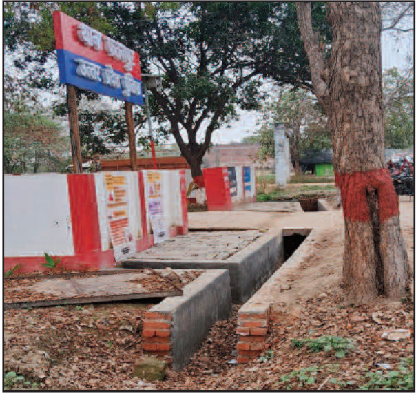
यह कौन सी योजना व किस मद से कार्य हुआ है यह तो विभाग के अधिकारी जानें। यह तो महज एक

लोकमित्र ब्यूरो प्रतापगढ़। जिले के विकासखंड गौरा में विकास कार्य होने के बाद टेंडर निकालकर धन की बंदरबांट करने के लिए कागजी कोरम पूरा कर लेते हैं। बुधवार को एक दैनिक समाचार पत्र में प्रकाशित कई ग्राम पंचायतों में 15 विभिन्न कार्यों को पूरा करने के लिए टेंडर निकाला गया है। यह सभी कार्य पक्की नाली, इंटरलॉकिंग, सड़क, क्षेत्र पंचायत निधि के द्वारा किया जाना प्रस्तावित है। इनमें से कई कार्य तो कई महीने पहले ही पूरे हो चुके हैं। इसके बावजूद खंड विकास अधिकारी की मिलीभगत से टेंडर निकालकर धन की बंदरबांट करने की जुगाड़ की जा रही है।