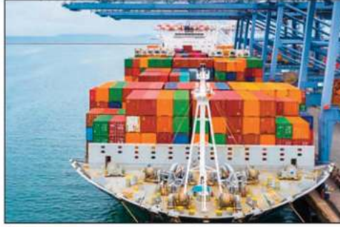
नई दिल्ली, (हि.स.)। भारत, अमेरिका से आयात होने वाले आठ उत्पादों से सीमा शुल्क हटाएगा। भारत द्वारा अतिरिक्त सीमा शुल्कों को रद्द करने की आधिकारिक सूची में 90 दिनों के बाद चना, दाल और सोब सहित आठ उत्पादों का आयात करना हो जाएगा।

यह आठ उत्पादों से सीमा शुल्क हटाएगा। प्रधानमंत्री नरेन्द्र मोदी की हार्दिक वार्ता अमेरिका का दौड़ा विश्व देशों के साथ व्यापार समझौते (डब्ल्यूटीओ) के उच्च अधिकारियों को खत करने और अमेरिका के उत्पादों पर प्रतिरोध स्थापित करने के लिए एक पत्र भेजना शुरू कर दिया है। भारत के अर्थ मंत्रालय ने अमेरिका से आयात होने वाले चना, दाल और सोब सहित आठ उत्पादों का आयात करना हो जाएगा।