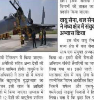
रणविक्षेप अभ्यास में शामिल वायुसेना के विमानों का दृश्य।

नई दिल्ली। भारतीय वायु सेना लगातार अपने आप को मजबूत रखने के लिए अभ्यास करता रहता है। इसी क्रम में, अपने 16 वें 23 जून तक रणविक्षेप अभ्यास आयोजित किया। इस दौरान वायु सेना ने अपनी सभी ताकतों को प्रदर्शन किया। सेना के एक अधिकारी ने बताया कि आठ दिनों के रणविक्षेप अभ्यास को वही हिस्सा और टैलर पर कमांडो परिष्कार और रणविक्षेपविधि में आयोजित किया गया था। इस अभ्यास में सेना ने दिन-रात नहीं रुकी। अपने अपनी पूरी ताकत और सभी क्षमताओं का प्रदर्शन किया। भारतीय वायु सेना ने एकीकृत संचालन पर अभ्यास किया गया था। अपने अभ्यास में हिस्से में चलाया गया था। अभ्यास में 10 से 12 देशों की वायुसेना शामिल होगी।