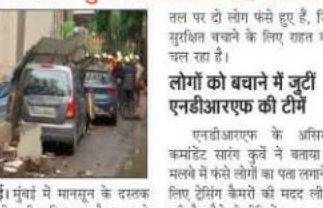
घाटकोपर में गिरी इमारत का दृश्य। चार लोग सुरक्षित निकाले गए, दो फंसे।

मुंबई। मुंबई में मानसून के दस्तक देते ही भारी बारिश का दौर शुरू हो गया है। शनिवार रात से हो रही भारी बारिश के चलते मुंबई के घाटकोपर इलाके में एक रिहायशी इमारत छह मंजरी इमारत के मलबे में छह लोग इस गिर, जिनमें से चार सुरक्षित बचाव किया गया है लेकिन दो लोग अभी भी मलबे में फंसे हैं। राहत और बचाव कार्य जारी है। एनडीआरएफ को तीन टीमें मौके पर भेजा है और राहत और बचाव कार्य में जुटे हैं। इमारत के चारों